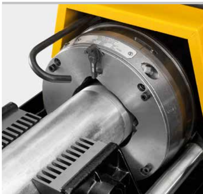
Продукция немецкого производства

Удобно использовать с автоматическим внутризажимным REMS Ниппельфикс \frac{1}{2} –4" или с ручным внутризажимным REMS Ниппельспанер \frac{3}{8} –2" (страница 46).