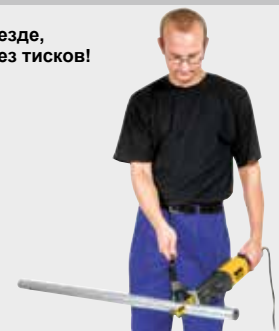
Продукция немецкого производства