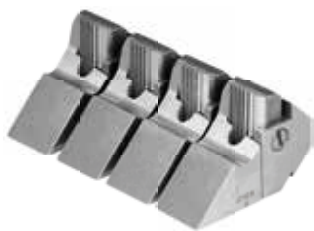
Német minőségi termék