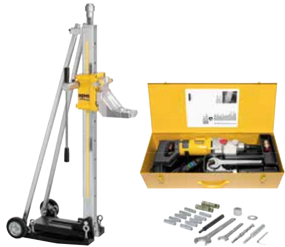
REMS Picus S3 Set Titan