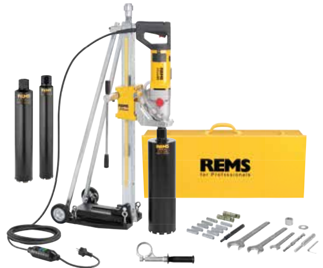
REMS Picus S3 Set 62-82-132 Titan