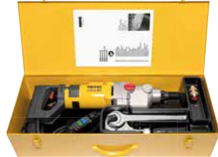
REMS Picus S3 Basic-Pack

Possibilité d'utiliser la colonne de carottage REMS Simplex 2 ou REMS Titan (page 240).