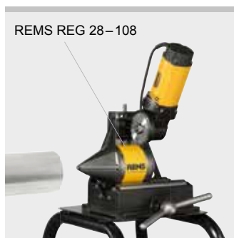
REMS REG 28–108