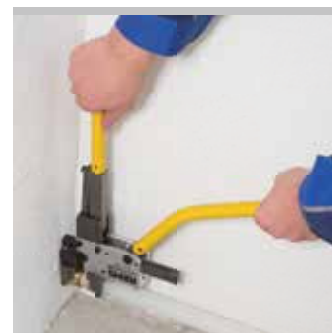
Kvalitní německý výrobek