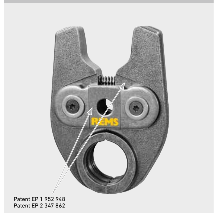
Alman Kalite Ürünü

Bu işlemle beraber geriye bakış sağlanır ve böylece REMS önerilerine uyumu gösteren EN Normlarında uygun EN 1775:2007 Gas fitting sistemlerini gösterir.