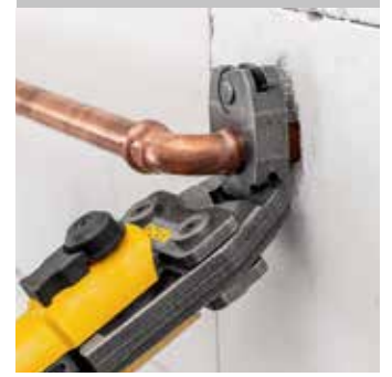
REMS pres halkası S (PR-2B), kademesiz döndürülebilir