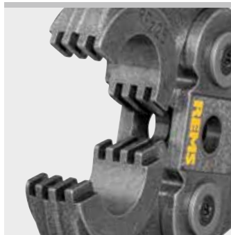
Dişli pres penseleri pres fittinglerde çapak oluşumunu önler. Patent EP 2 027 971