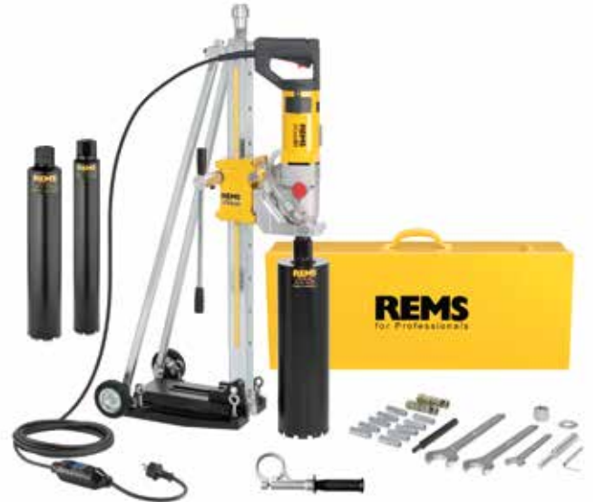
REMS Picus S3 seti 62-82-132 Titan