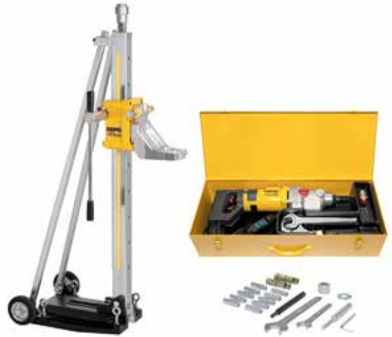
REMS Picus S3 seti Titan