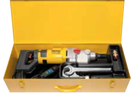
REMS Picus S3 Basic-Pack

Tercihe göre REMS Simplex 2 veya REMS Titan delme sehpaı kullanılabilir (Sayfa 310).