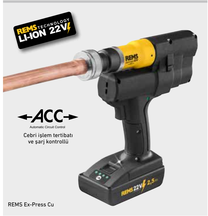
REMS Ex-Press Cu

Saniyeler içinde kusursuz genişletme için yüksek genişletme kuvveti. İtme kuvveti 20 kN. Otomatik geri hareketli (ACC) güçlü elektro-hidrolik tahrik, güçlü akü-motor 21,6V, 380W verilmesi, dayanıklı planet dişli düzeneği, eksantrik pistonlu pompa ve kompakt yüksek performanslı hidrolik sistemi, dokunma tipi emniyetli şalter. Dokunma tipi emniyetli şalter.