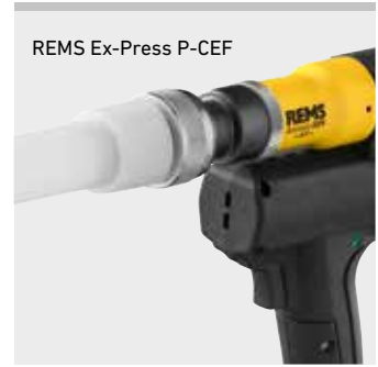
REMS Ex-Press P-CEF