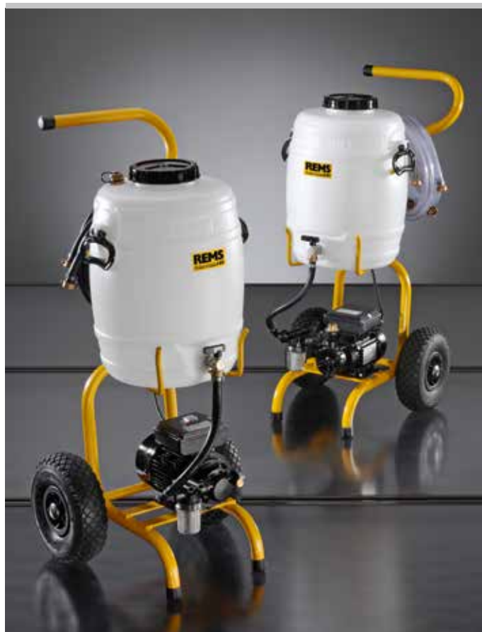
Producto alemán de calidad

Válvula de cierre para cerrar la conducción de presión o retorno, p. ej. durante el transporte. Filtro fino con bolsa de filtración fina 70 µm, compuesto por tapa roscada con conexión de retorno para conducción de retorno con conexión ¾", adaptador y bolsa de filtración fina 70 µm, o filtro fino con elemento de filtración fina 90 µm, lavable, con gran depósito colector de suciedad, para conducción de retorno ¾", para lavar calefacciones de suelo/pared y eliminar lodos. Válvula de inversión de caudal completa con manguera flexible EPDM ½" T100, para lavado de calefacciones de suelo / pared y limpieza eficaz de lodos mediante golpes de presión por inversión de la dirección de flujo. Válvula de inversión para aspiración alternativa de sustancias de transporte desde otro depósito, p. ej. para volúmenes superiores.