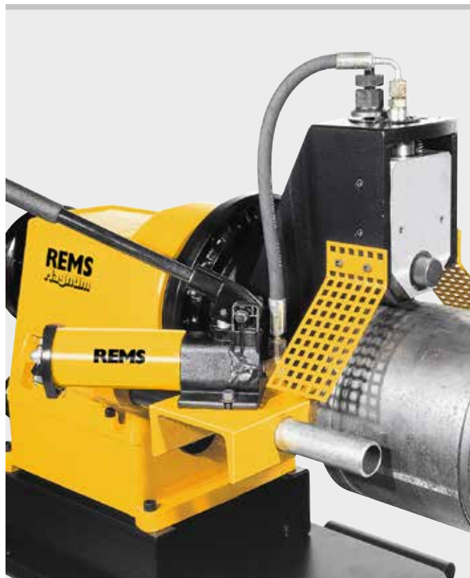
Producto alemán de calidad

Soportes de gran estabilidad REMS Herkules XL 12", para ranurar en tubos hasta 12" (página 115).