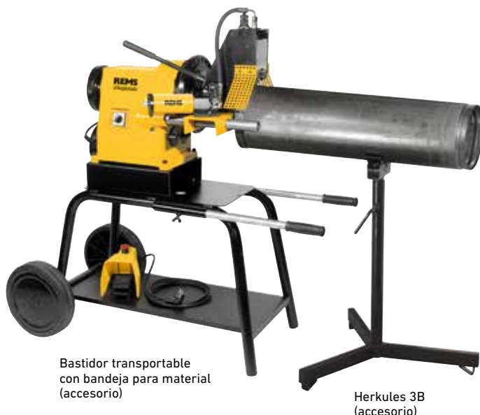
Bastidor transportable con bandeja para material (accesorio)