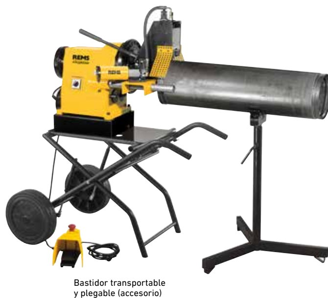
Bastidor transportable y plegable (accesorio)