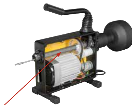
El conducto de espirales estanco protege motor y engranaje de suciedad y agua.