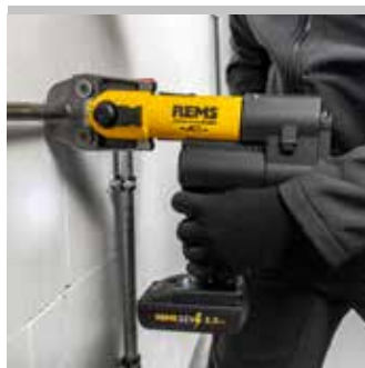
Producto alemán de calidad