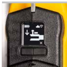
Control eléctrico de la posición de cierre del perno portatenazas.