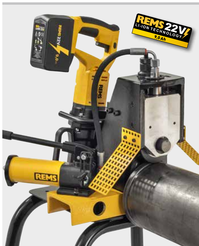
Producto alemán de calidad

Soportes de gran estabilidad REMS Herkules XL 12", para ranurar en tubos hasta 12" (página 115).