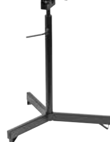
Herkules 3B (accesorio)