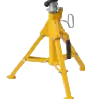
Herkules XL 12" (accesorio)