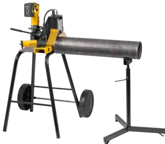
Bastidor transportable (accesorio)