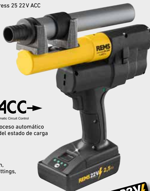
REMS Ax-Press 25 22V ACC

Diversos expandidores de tubo y completo surtido de cabezales de expandir REMS para todos los sistemas convencionales de casquillo corredizo (página 273–277).