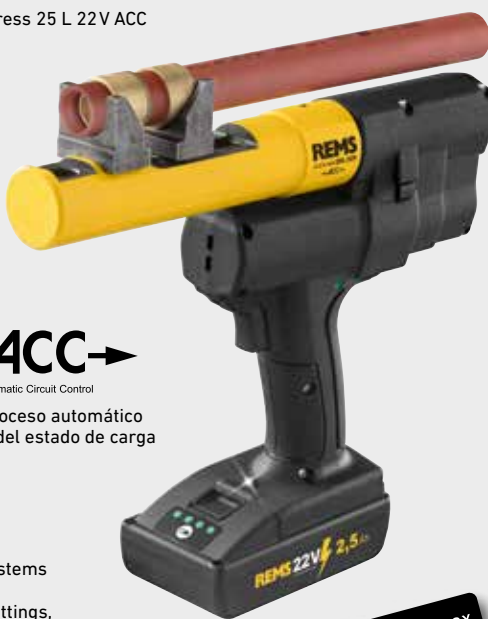
REMS Ax-Press 25 L 22V ACC