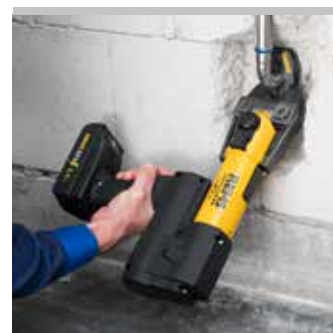
Producto alemán de calidad