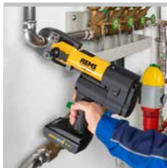
Producto alemán de calidad