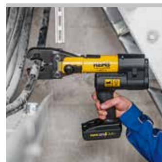
Producto alemán de calidad