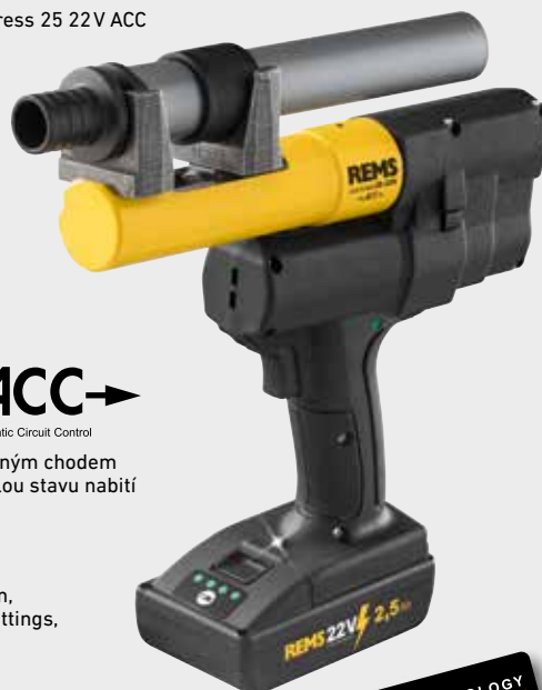
REMS Ax-Press 25 22V ACC

Různé rozšiřovače trubek a kompletní sortiment rozšiřovacích hlav REMS pro všechny běžné systémy s tlakovými kroužky (strana 253–257).