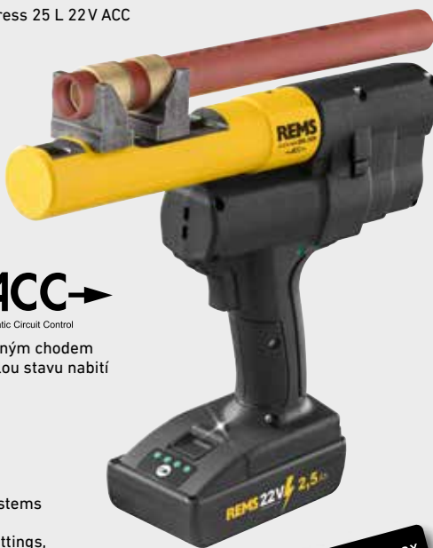
REMS Ax-Press 25 L 22V ACC