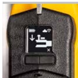
Elektricky sledovaná zavřená poloha zajišťovacího čepu kleští.