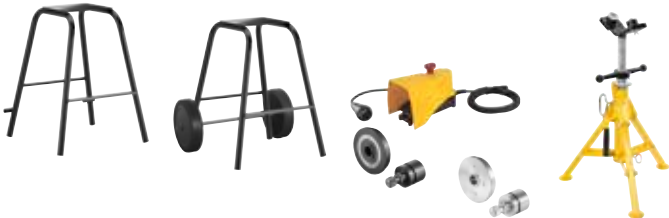
Herkules 3B (Поставляется отдельно)