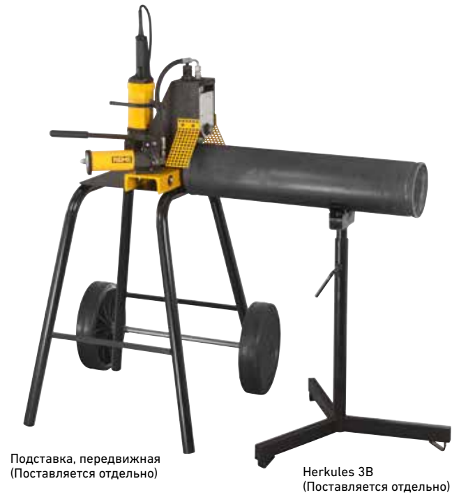
Подставка, передвижная (Поставляется отдельно)