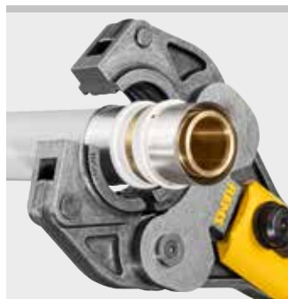
REMS prestang (PZ-S)