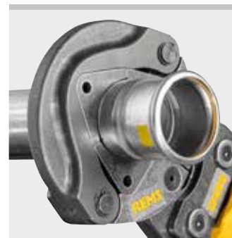
REMS pressring (PR-3S)