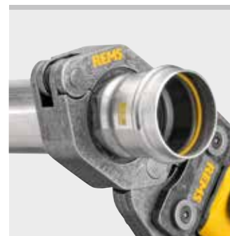
REMS pressring (PR-2B)