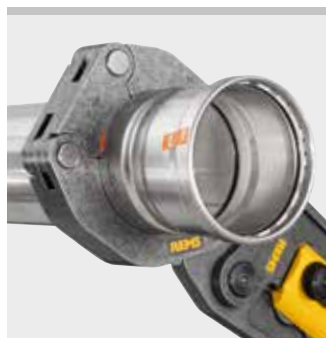
REMS pressring (PR-3B)