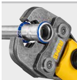
REMS prestang (PZ-2B)