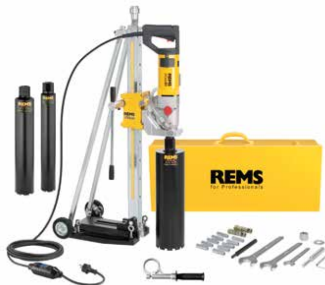
REMS Picus S3 Set 62-82-132 Titan