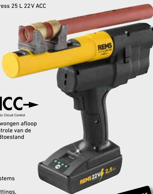
REMS Ax-Press 25 L 22V ACC