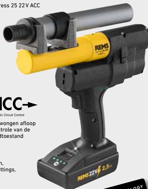
REMS Ax-Press 25 22V ACC

Verschiede buisoptrompers en het complete assortiment REMS optrompkoppen voor alle gangbare drukhulssystemen (pagina 253–257).