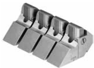
Kokybiškas vokiškas gaminy