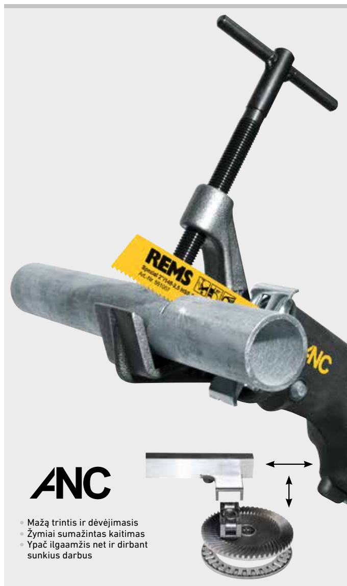
Kokybiškas vokiškas gaminy

Sąmoningai nustatyta reikšmė. Tai optimalus pjovimo greitis, tausojantis variklį ir