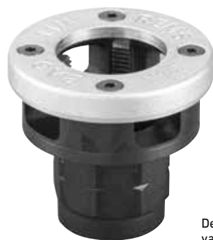
Dešinysis vamzdinis sriegis