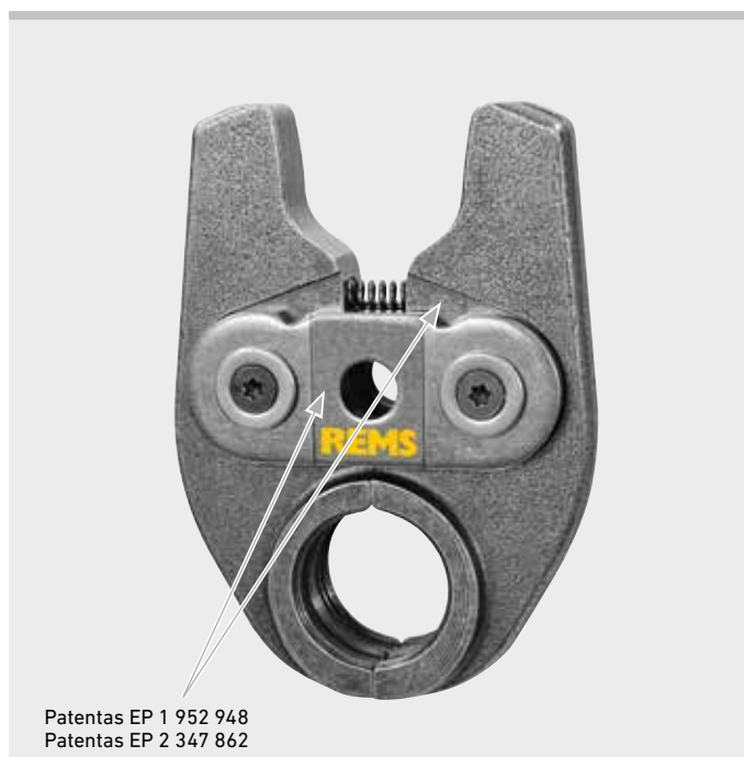
Patentas EP 1 952 948 Patentas EP 2 347 862

Su šia atsekamumo galimybe REMS įgyvendina Europos standarto EN 1775:2007 rekomendacijas įrengiant dujų vamzdynų presuojamųjų jungčių sistemas.