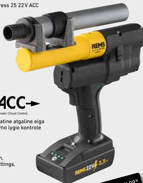
REMS Ax-Press 25 22V ACC

Tiekiami įvairūs vamzdžių plėstuvi ir visas REMS plėtimo galvutėlių asortimentas visoms paplitusioms ašinių movų sistemoms (253–257 psl.).