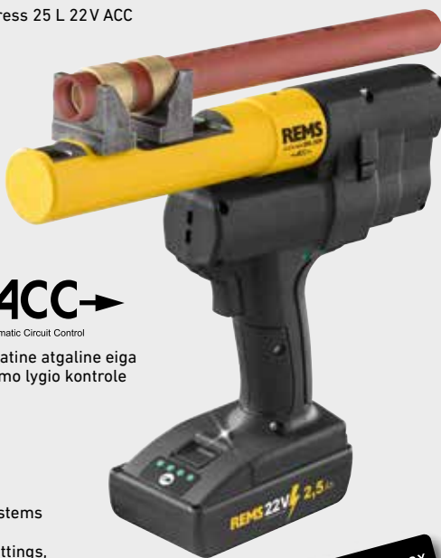
REMS Ax-Press 25 L 22V ACC