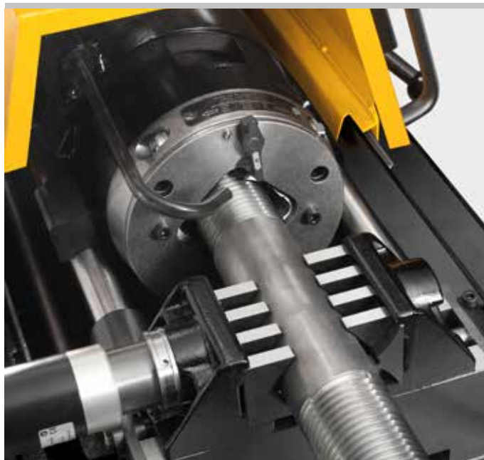
Prodotto tedesco di qualità

Pettini speciali Strehler M con intaglio supplementare, per filettare su tondino spiralato per cemento armato. Azionamento mediante REMS Unimat 75 con morsa oleidraulica-pneumatica, per un'alta pressione di serraggio.