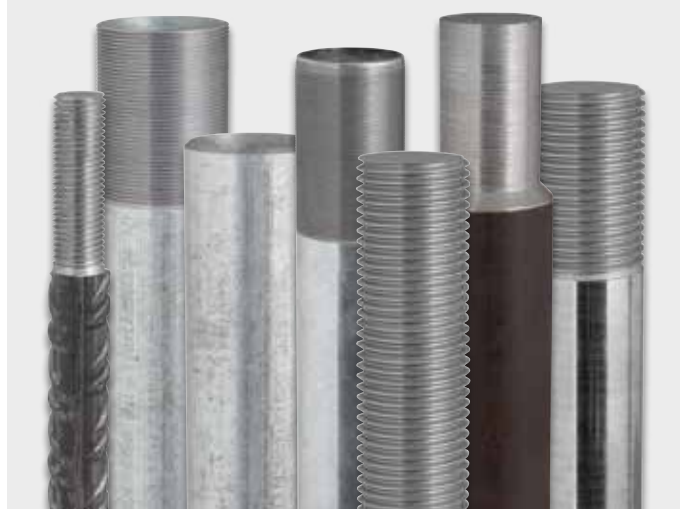
Esempi di lavorazione