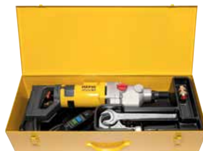
REMS Picus S3 Basic-Pack

Localizzatore elettronico del centro del foro, per determinare esattamente il centro in entrata e in uscita di fori passanti, vedi pagina 370.