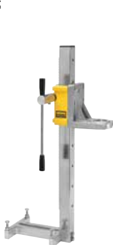
REMS Simplex 2