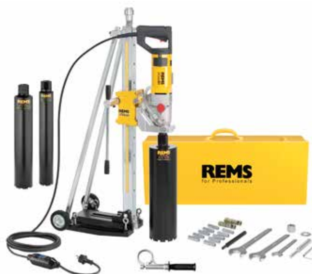
REMS Picus S3 Set 62-82-132 Titan