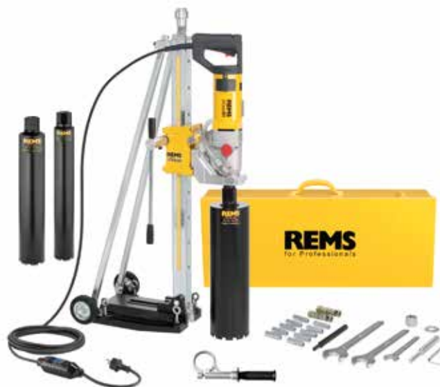
REMS Picus S3 Set 62-82-132 Titan