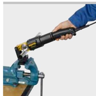
Prodotto tedesco di qualità