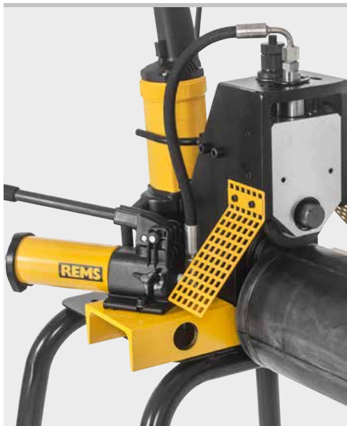
Prodotto tedesco di qualità

Supporto per materiale estremamente stabile REMS Herkules XL 12" per scanalare tubi fino a 12" (pagina 115).