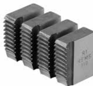
Német minőségi termék