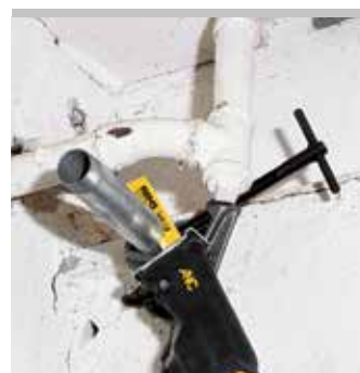
Produit allemand de qualité