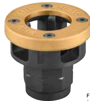
Filetage de tubes à gauche