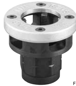
Filetage de tubes à droite