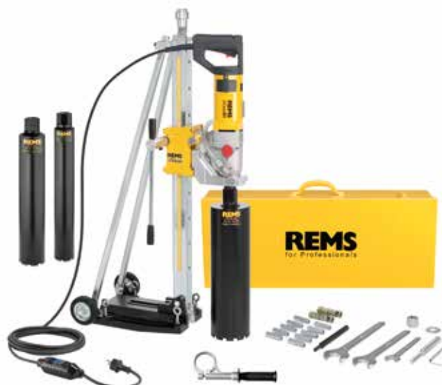
REMS Picus S3 Set 62-82-132 Titan