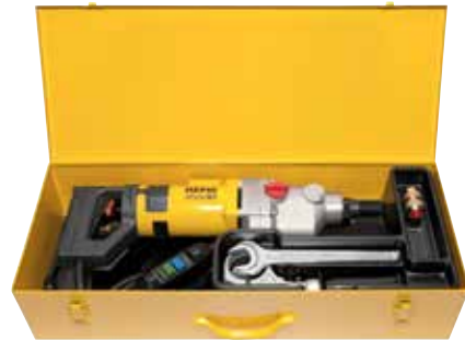
REMS Picus S3 Basic-Pack

Possibilité d'utiliser la colonne de carottage REMS Simplex 2 ou REMS Titan (page 310).