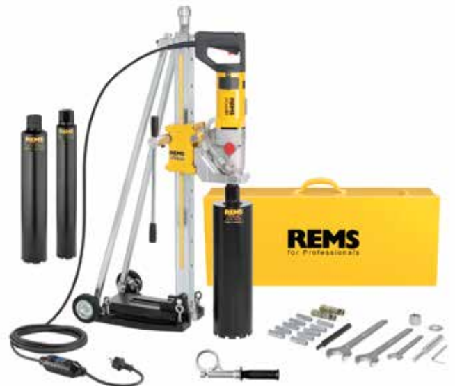
REMS Picus S3 Set 62-82-132 Titan