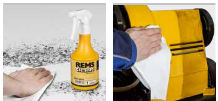
Produit allemand de qualité

REMS CleanM Vaporisateur sans agent propulseur.