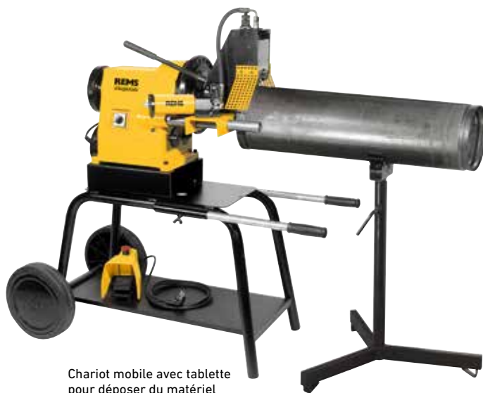
Chariot mobile avec tablette pour déposer du matériel (accessoire)