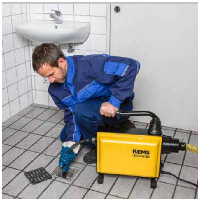
Produit allemand de qualité

Choix important d'outils de nettoyage pour tubes (page 288 – 289), s'adaptant aussi sur les machines de débouchage pour tubes d'autres marques.