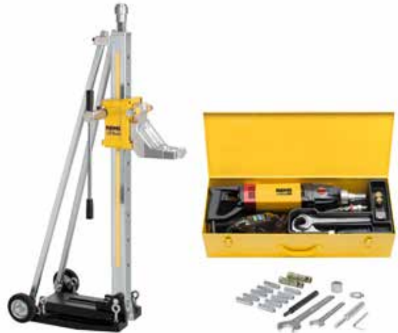
REMS Picus SR Set Titan