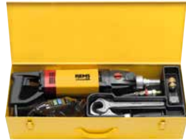
REMS Picus SR Basic-Pack

Appareil électronique pour l'alignement précis des trous d'entrée et de sortie des carottages traversants, voir page 340.