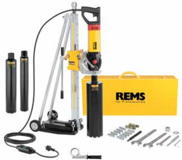
REMS Picus SR Set 62-82-132 Titan