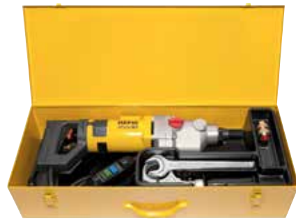
REMS Picus S3 Basic-Pack

Appareil électronique pour l'alignement précis des trous d'entrée et de sortie des carottages traversants, voir page 340.