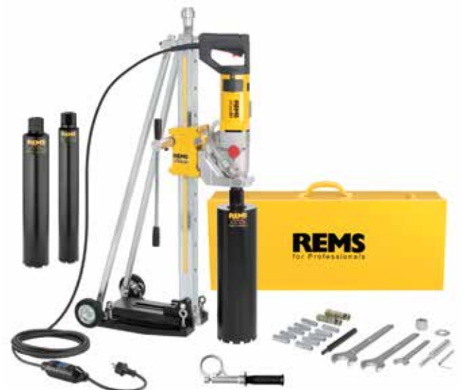
REMS Picus S3 Set 62-82-132 Titan