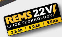
REMS Ax-Press 25 L 22V ACC

Par ex. aquatherm, General Fittings, IVT, REHAU, REVEL, Seppelfricke, TECE, TIEMME, Würth