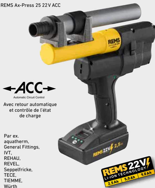
REMS Ax-Press 25 22V ACC

Différents emboîteurs et gamme complète de têtes à emboîtures REMS pour tous les systèmes par compression de bagues à glissement courants (page 273 – 277).