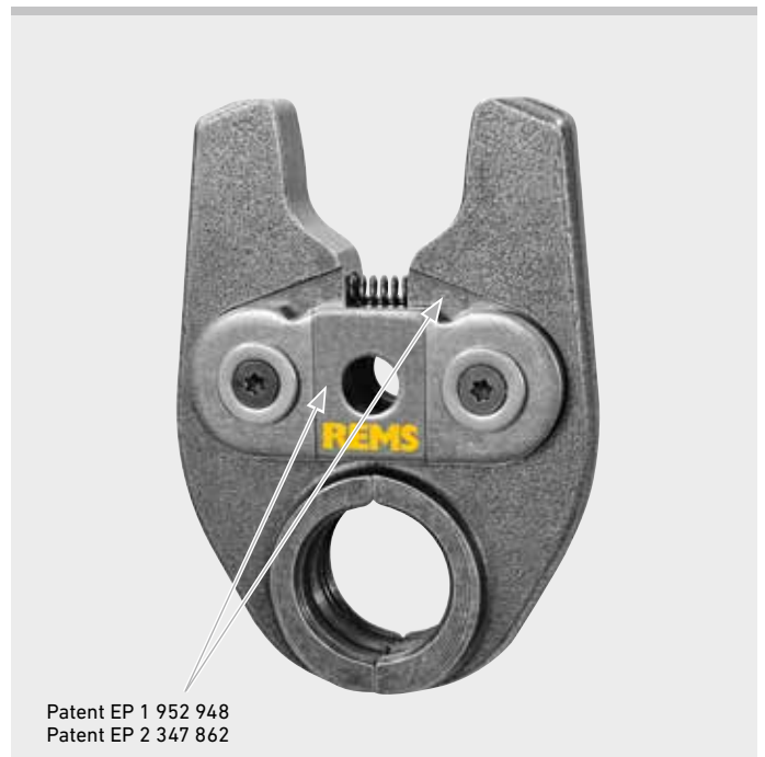
Patent EP 1 952 948 Patent EP 2 347 862

With this traceability REMS fulfils the recommendations of the European standard EN 1775:2007 for the installation of pressfitting systems for gas.