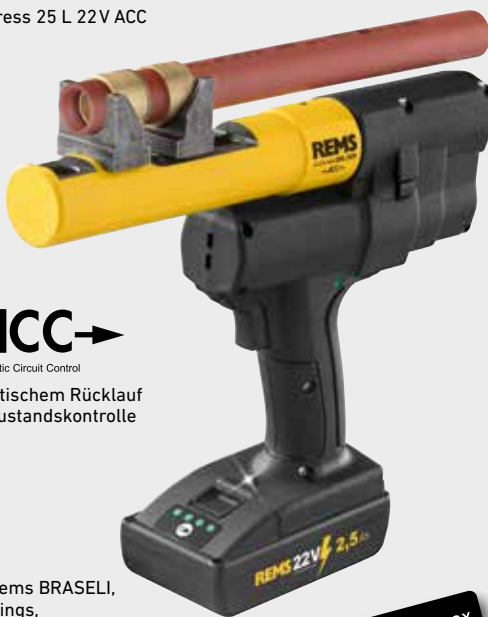
REMS Ax-Press 25 L 22V ACC