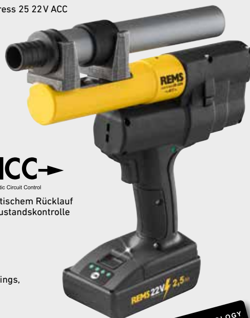
REMS Ax-Press 25 22V ACC

Verschiedene Rohraufweiter und komplettes Sortiment REMS Aufweitzköpfe für alle gängigen Druckhülsen-Systeme (Seite 253 – 257).