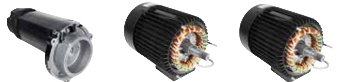
3 leistungsstarke Motoren zur Wahl.