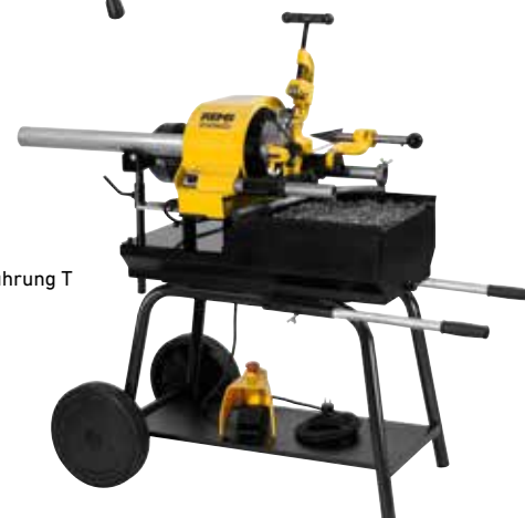
Untergestell, fahrbar, mit Materialablage (Zubehör)