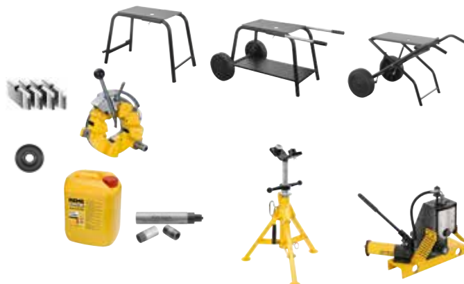
Untergestell, fahr- und klappbar (Zubehör)