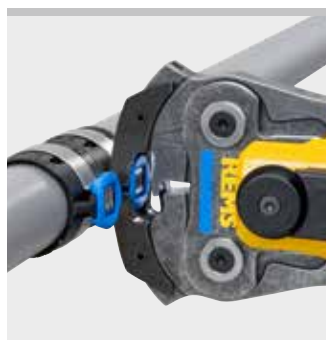
REMS Presszange Mini GFF