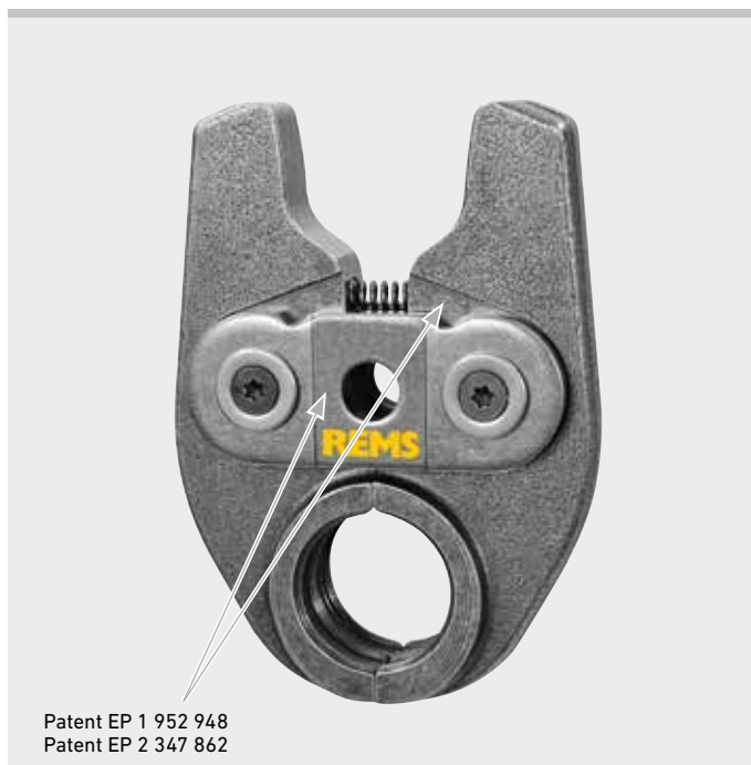
Patent EP 1 952 948 Patent EP 2 347 862

Mit dieser Rückverfolgbarkeit erfüllt REMS die Empfehlungen der Europäischen Norm EN 1775:2007 bei der Installation von Pressfitting-Systemen für Gas.