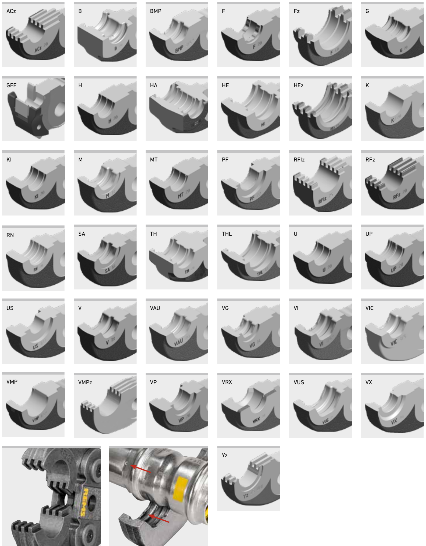
Presszangen mit Verzahnung verhindern Gratbildung am Pressfitting Patent EP 2 027 971