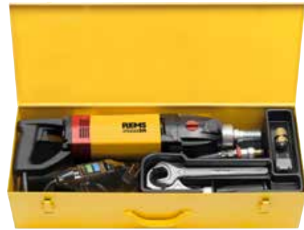
REMS Picus SR Basic-Pack

Wasserabsaugvorrichtung zum Nassbohren bis Ø 170 mm, bestehend aus Wassersammelring mit Anschluss für REMS Pull 2 oder andere geeignete Nasssauger, Druckring, Gummischeibe Ø 200 mm, anpassbar an Durchmesser der Bohrkrone, und Universalniederhalter für alle REMS Bohrständer, als Zubehör.