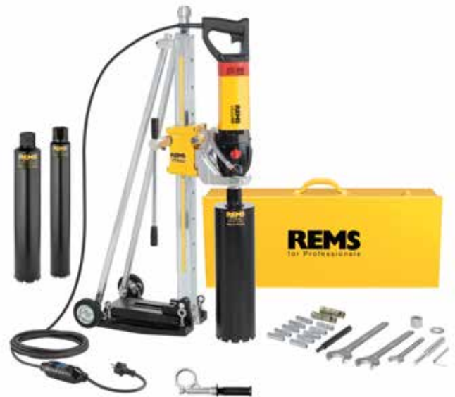
REMS Picus SR Set 62-82-132 Titan