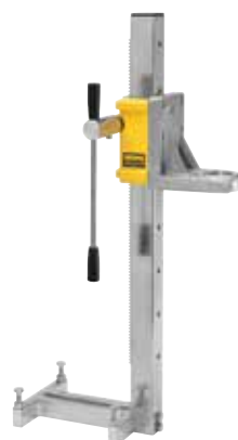
REMS Simplex 2