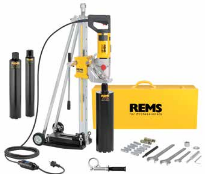
REMS Picus S3 Set 62-82-132 Titan