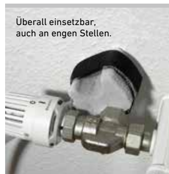
Überall einsetzbar, auch an engen Stellen.