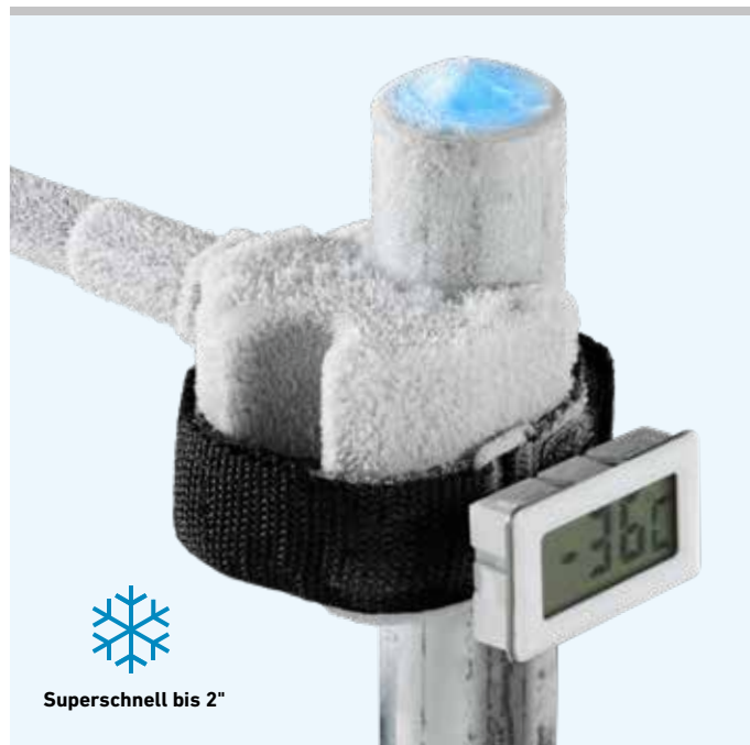
Superschnell bis 2"

LCD-Digital-Thermometer mit Klemmbügel, für genaue Temperaturanzeige direkt an den Einfrierstellen.